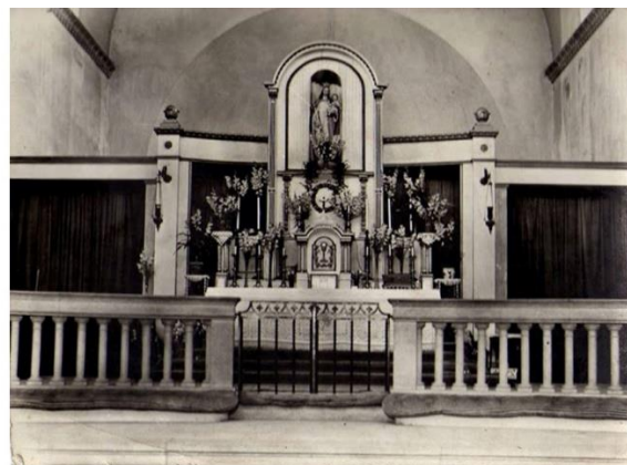
A Magna Domina Hungarorum-templom főoltára

Azóta több aláírás kezdeményezés volt, hogy egy új Regnum Marianum templomot építsenek, de az esztergomi érsek és a püspöki kar elutasít minden kezdeményezést, mondván, hogy nincs szükség egy új templomra.