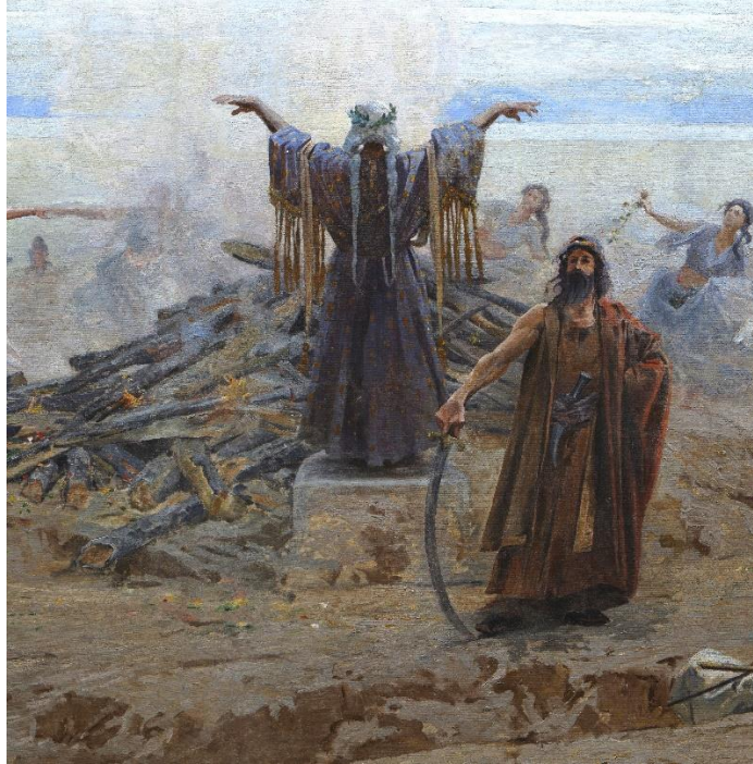
A körképen a táltos modellje állítólag Feszty felesége volt

A magyar hagyományban a mágus helyett inkább a táltost használjuk, így hívjuk a személyt a Feszty körképen is.