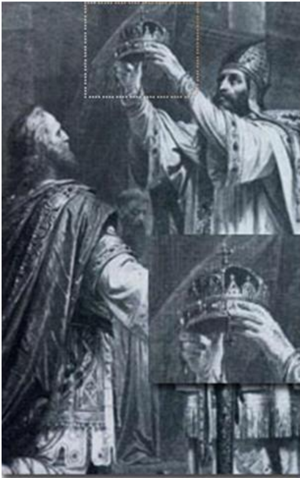
Részlet a festményből, amelyben a korona külön ki van emelve