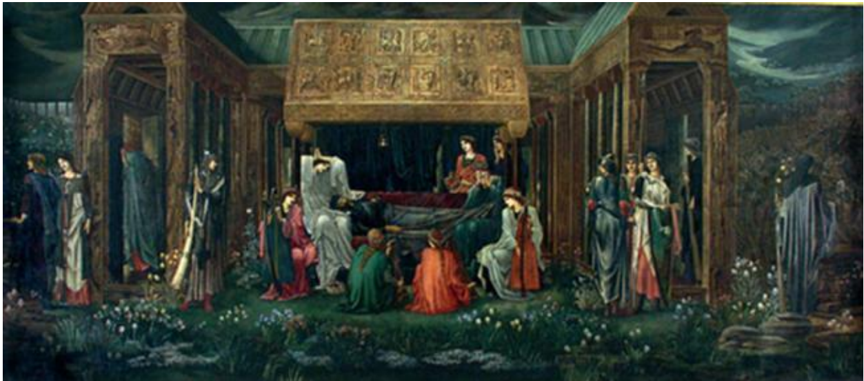
Burne-Jones, Artur Király utolsó éjszakája (teljes kép)

De Artúr királynak persze nem volt valóságos koronája, amelyet meg lehetett volna festeni, ezért Burne-Jones ugyanúgy, mint Kaulbach, meg kellett találnia a megfelelő koronát