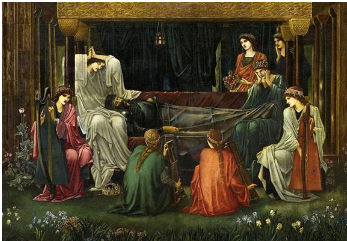
A Korona az angyal lábánál

Önökre bízom annak eldöntését, hogy a véletlen műve volt-e, vagy valami sugallat, hogy Burne-Jones ahelyett, hogy valamelyik brit birodalmi vagy egy szimbolikus koronát használt volna, Artúr király mellé ugyanazt a koronát festette, amelyet Kaulbach használt Nagy Károly megkoronázásához. A mi Szent Koronánk hever Artúr király ágya előtt. Ekképp a Szent Korona és a két királyt ábrázoló képen a Nagy Károly koronázása a középkori európai keresztény civilizáció kezdetét jelenti, és Artúr halála és a Korona a padlón a végét jelképezi.